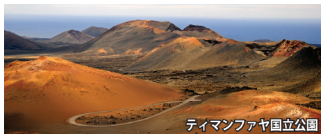
ティマンファヤ国立公園

カナリア諸島最東部。火山噴火の繰り返しによって形成された島。300以上のクレーターが見られるティマンファヤ国立公園はまるで月面世界です。実際に地熱で地面が熱い場所や、地殻変動でかつての海が閉じ込められた緑の塩湖エル・ゴルフ湖など、ダイナミックな地球の活動を体感出来る島です。