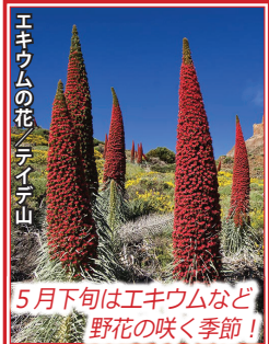
エキウムの花とティエデ山 5月下旬はエキウムなど野花の咲く季節!

カナリア諸島で最大の緑豊かな島。スペイン最高峰のティエデ山(3,718m)があり、周辺は国立公園に指定されております。また、古いカナリア式建築の残るオロトヴァなど、歴史ある街並みも見所。16世紀の街並みが残るサン・クリストバル・デ・ラグーナは世界遺産。ガイマールのピラミッドや数千年の樹齢・巨大な竜血樹ドラゴ・ミレナリオもご覧いただけます。