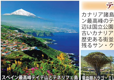
スペイン最高峰ティエデ山とテネリフェ島