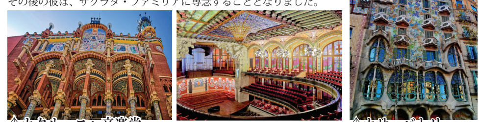
↑カタルーニャ音楽堂 巨匠ドメネク・モンタネールの最高傑作、モデルニスモ建築で最も美しいと言われています。カタルーニャの守護聖人サン・ジョルディの彫刻で飾られた建物正面、そして中央にステンドグラスのシャンデリアがある大ホールは圧巻。

↑カサ・パトリヨ ガウディの傑作建築。海がテーマに造られ、波打ちデザインが印象的。