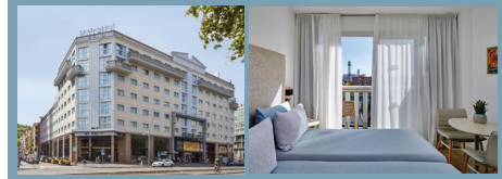
※写真はすべてイメージです

❖インサイド・パイ・メリア・バルセロナ・アポロ 旧市街の西、アポロ劇場横に位置するファーストクラス・ホテル。ランブラス通りまで徒歩10分少々。サン・ジュセップ市場、港にも徒歩圏と便利な立地。メトロのパラレル駅が至近で、サグラダ・ファミリアやカタルーニャ広場など主要観光地まで乗り換えなしで行くことができます。