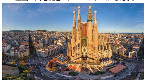
↑サグラダ・ファミリア 当ツアーでは鐘楼の上や、地下博物館までご案内します。