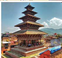
▲ニャタポラ寺院の五重塔 / 古都バクタブル

ネワール族が多く暮らす古都パタンは、今なお伝統文化が息づく「美の都」と呼ばれます。レンガ造りの中世の建物が多く残るバクタブルなどにも世界遺産に指定されています。