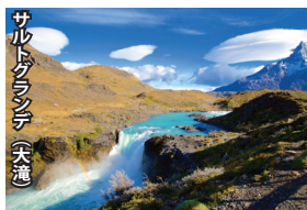
サルトグランデ(大滝)