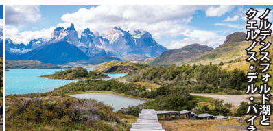
クエルノスフォルド湖とパイネ