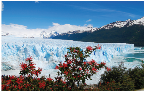
▲パタゴニアを代表するワイルドフラワー「ノートロ」

※第5日目氷河湖クルーズは、他のお客様との混載観光となります。また、これらの観光は、悪天候の場合、中止となる場合がございます。 ※その日の天候や光の具合などにより、実際の景観が当パンフレットの写真イメージと異なる場合もございます。予めご承知おき下さい。 ※天候によっては、ハイキングを中止せざるを得ない場合もございます。その場合のご返金はございません。