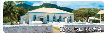
教会/ラロトンガ島