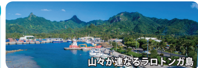
山々が連なるラロトンガ島

ニュージーランドの北東約3,000km離れた南太平洋に大小15の島々からなるクック諸島。15の島々は1,000kmの海を隔てて北クック諸島と南クック諸島に分かれています。面積は237km 2 (大阪市とほぼ同じ)。人口19,200人。首都は南クック諸島のラロトンガ島アバルア。ラロトンガ島は熱帯雨林に覆われた標高400～500mの山々が連なっています。公用語はクック諸島マオリ語と英語。宗教はキリスト教。ニュージーランドと自由連合関係があり、国民はニュージーランドの国籍を有します。46カ国と外交関係があり、2011年に日本も国家として承認しております。