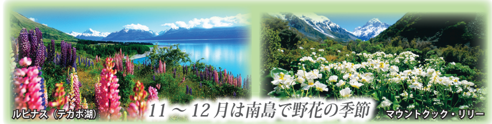
ルピナス(テカポ湖) 11~12月は南島で野花の季節 マウントクック・リリー

※天候によっては、ハイキングや星空観測ツアーが中止となる場合もございます。予めお含みおき下さい。 ※移動の車は、小型〜中型バスになる場合もございます。 ※ロトルアの観光、テカポの星空観測ツアーなどは、現地混載ツアーに参加しての観光となります。 ※観光順序を入れ替えてご案内する場合もございます。 ※「マウントクックビュー」及び「レイクビュー」の部屋とは、ホテル側がそのように規定する部屋を指し、必ずしも山や湖の全景が見渡せるとは限らないこと、ご了承下さい。