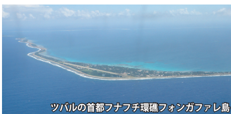
ツバルの首都フナフチ環礁フォンガファレ島

ツバルは7つの環礁と2つの島からなるポリネシア最西端の国で、首都フナフチ環礁は赤道の南約1,000km、フィジーの北1,100kmに位置しています。南北800kmに連なる9つの環礁島は全て低い島であり、最高所でも海拔5mしかなく、地球温暖化による海面上昇により、国家が水没の危機に直面しているといわれています。また、パチカン市国について、世界で2番目に人口の少ない国としても知られています。1978年英国より独立。主要言語は英語とツバル語。宗教はキリスト教。