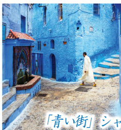
「青い街」シャウエンに2連泊