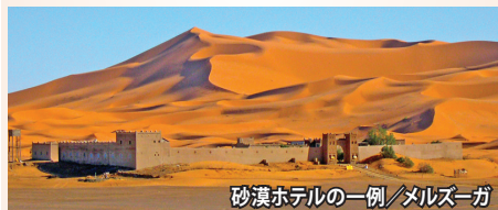
砂漠ホテルの一例/メルズーガ

世界最大・幻想のサハラ砂漠に抱かれた一夜をどうぞ。見渡す限りの砂の海、静寂の空間。そこは喧噪の日常を離れた別世界です。夕暮れ時の砂漠は、黄金色から深紅のバラ色へ、そして深いワイン色へと表情を変えて行きます。やがて深い闇が訪れ、ふと空を見上げると、今にも降り出しそうに星々が輝き始めます。まさに天然のプラネタリウム。世界中でここでしか味わうことの出来ないこの上ない贅沢なひとときをお楽しみ下さい。