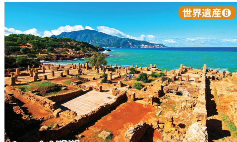
ティバサ遺跡 紀元前7世紀にフェニキア人により建設され、カルタゴとの交易中継地でした。1世紀にはローマの植民地となり繁栄しましたが、アラブ人により滅ぼされ、7世紀には廃墟となりました。ティバサはアラブ語で「荒廃した町」。

イヤホンガイド・サービスを使用します。 昼食時、夕食時にドリンク・ウォーターをサービスします。