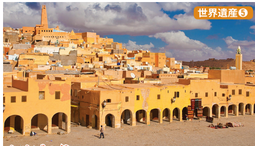
ムザブの谷 砂漠の中に忽然と姿を現すオアシスの町。立方体住宅が密集するその町並みは、都市構想、地下灌漑水路など今に通じる建築技術を残しています。そのキュビズム風建築に魅了され、名建築家ル・コルビュジェは何度も訪れたのです。