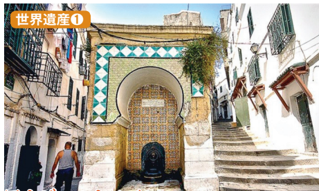
アルジェのカスバ 映画『望郷』の舞台として知られるカスバは、アルジェ旧市街の北にある標高約120mの丘の斜面に広がります。カスバとはアラビア語で要塞を意味します。狭い石段や家々がひしめきあがる街路は、まるで迷路のよう。