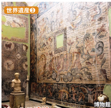
ジェミラ遺跡 アラビア語で「美しい」という意味のローマ遺跡。かつての栄華を物語る保存状態の良い遺跡群です。博物館には北アフリカ屈指の傑作モザイクが残ります。