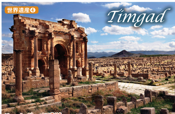
ティムガッド遺跡 紀元2世紀に基盤目状の典型的なローマ都市の構造で町は設計されました。8世紀に地震に見舞われたティムガッドは、1881年に発見されるまで砂に埋もれていたため、とても保存状態が良い遺構がご覧いただけます。