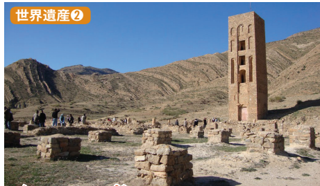
ベニ・ハマッド ハマッド朝の都ベニ・ハマッドは11世紀、アラブ世界の交易の中継地として栄えました。当時造られたモスクはアルジェリアで2番目の大きさで、高さ25mのミナレットは今でもその姿を残しています。