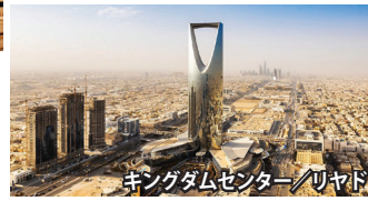
聖地メディナも訪問/預言者のモスク キングダムセンター/リヤド