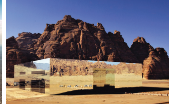
マラヤ・コンサートホール アルウラの砂漠地帯に建つコンサートホール。9,740枚の鏡張りのパネルで覆われ、「世界最大の鏡張り建造物」としてギネスブックに認定。