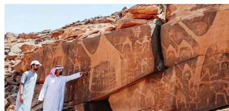
世界遺産ジュッパの岩絵 1万年以上前の遊牧民がラクダやガチョウなどの動物の姿を描いた岩絵が残ります。かつてこの地は草原のサバンナが広がっていたと考えられています。