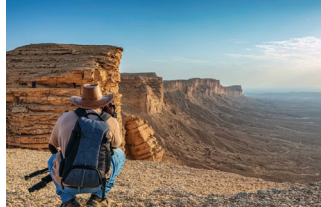
エッジ・オブ・ザ・ワールド リヤド郊外、高さ300mにも及ぶ崖が広がる場所。崖の上から望む地平線遠くまで広がる光景は、その名に相応しい壮大な景観。

※サウジアラビアはアラブの国の中でも厳格なイスラム教国です。アルコール類や豚肉製品の持ち込みは厳禁で、1日に5回ある礼拝の時間にはお店は閉まります。また、かつて女性観光客は全身を覆い隠す「アバヤ」と呼ばれる衣装を着用しなければなりませんでした。観光査証の解禁に伴って服装に関する規定も緩和されました。アバヤを着用する必要はありませんが男女ともに肩や膝などの肌の露出を控えた適切な服装を心がけて下さい。聖地メディナ観光の際、女性の方は髪を隠す必要がありますので、大きめのスカーフなどをお持ち下さい。 ※遺跡その他の訪問地は、宗教・政治的行事の開催や政府命令、その他の事情により、訪問や入場が出来なくなることもございます。また、写真撮影なども急速禁止されることもございます。 ※羽田空港発着となる場合もございます。羽田発となった場合、空港使用料・保安サービス料は3,050円となります。