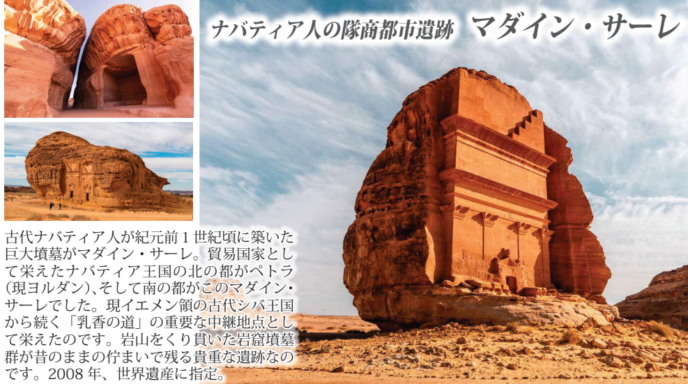
ナバティア人の隊商都市遺跡 マダイン・サーレ

古代ナバティア人が紀元前1世紀頃に築いた巨大墳墓がマダイン・サーレ。貿易国家として栄えたナバティア王国の北の都がペトラ(現ヨルダン)、そして南の都がこのマダイン・サーレでした。現イエメン領の古代シバ王国から続く「乳香の道」の重要な中継地点として栄えたのです。岩山をくり貫いた岩窟墳墓群が昔のままの佇まいで残る貴重な遺跡なのです。2008年、世界遺産に指定。