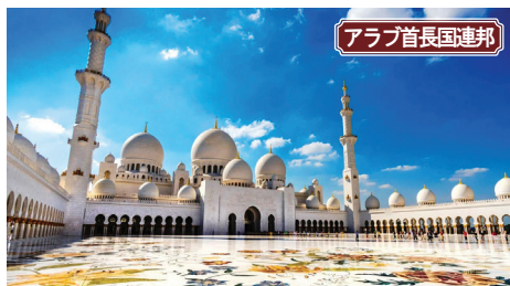
アラブ首長国連邦