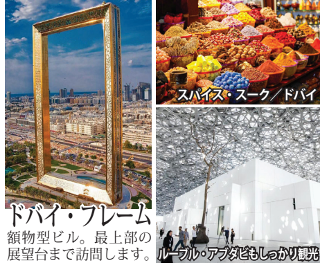
スパイス・スーク/ドバイ