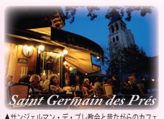
▲サンジェルマン・デ・ブレ教会と昔ながらのカフェ

サンジェルマン・デ・ブレ地区 とは、ルーブル美術館の南のセーヌ左岸地域。初めて教会が出来たエリアで、古い建物が残る歴史ある地区。洗練された最先端のショップから地元の人々で賑わうのマルシェ、骨董品屋、ベルエポック時代からそのままの姿で残るカフェなど、散歩して飽きることのない地域です。