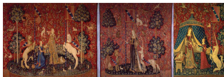
▲6帳のタピストリー「貴婦人と一角獣」/クリュニー中世美術館