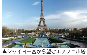
▲シャイヨー宮から望むエッフェル塔