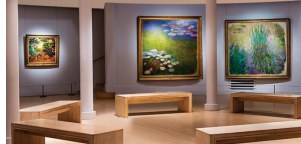
▲モネのコレクションで知られるマルモッタン美術館