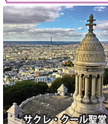
サクレ・クール聖堂