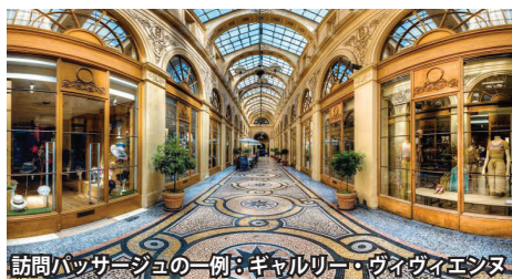
訪問パッサージュの一例：ギャラリー・ヴィヴィエニス

パッサージュ 18世紀後半、当時歓楽街だった大通りグラン・ブルヴァールを中心にガラス屋根に覆われたアーケード街「パッサージュ」が誕生しました。廃れた時期もありましたが、改修されレトロな空気に包まれた静かな散歩道となっています。