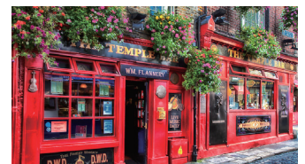
首都ダブリンの繁華街テンブルバー