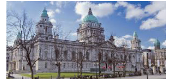
北アイルランド首府ベルファスト

8月末、薄紫色の儂げなヒースの花が、大地を覆い尽くすアイルランドが一年で最も輝く季節です。厳しく過酷な大自然とある時は戦い、そして共存しながら生活を営むアイルランドの人達の心の風景がここにあります。※ヒースの花は、その年の気候などにより、開花時期が変わる場合もございます。予めお含みお下さい。