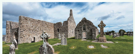
アイルランド十二使徒が建造したクロンマクノイズ修道院跡