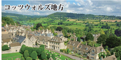
コッツウォルズ地方 ロンドンの西北西200km、標高300m前後の丘陵地帯。羊毛産業で栄えた町並みが中世の姿のまま残り訪れる人々を魅了します。