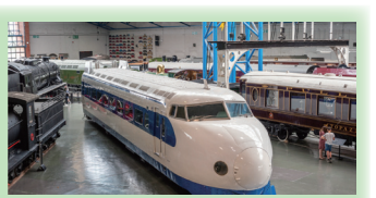
ヨークの国立鉄道博物館の0系新幹線