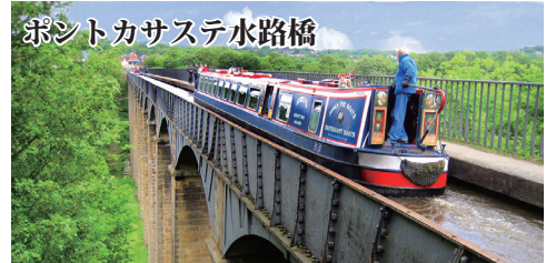
ポントカサステ水路橋 産業革命以降イギリス全土に張り巡らされた水路を今なお走るナローボート。高さ38m長さ307mの世界遺産の水路橋を渡ります。