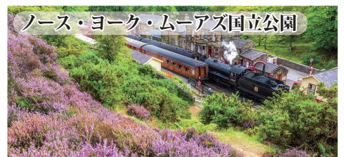
ノース・ヨーク・ムーアズ国立公園 ヨークの北に広がる原野ノース・ヨーク・ムーア。夏には紫色のヒースの花が咲き乱れます。公園内に1時間の鉄道の旅をお楽しみいただけます。