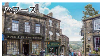
ハワース エミリー・プロンテ「嵐が丘」の世界