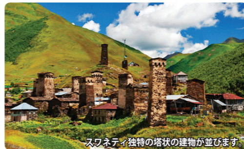
スワネティ独特の塔状の建物が並びます。

その桃源郷は大コーカサス山脈の懐深く、美しい峡谷の中にあります。歴史的に外部と隔絶されていたため、独自の伝統文化が残ります。一番の特色は石で出来た塔状の家。12世紀に造られたものが多く、この地域には約200の塔が残っています。スワネティ最奥のウシュグリでは、雪を被る5000m級の大コーカサスの峰々、独特の塔状の家々と緑鮮やかな尾根の美しいコントラストが見られます。まさにこれこそが桃源郷と呼ぶべき光景なのです。