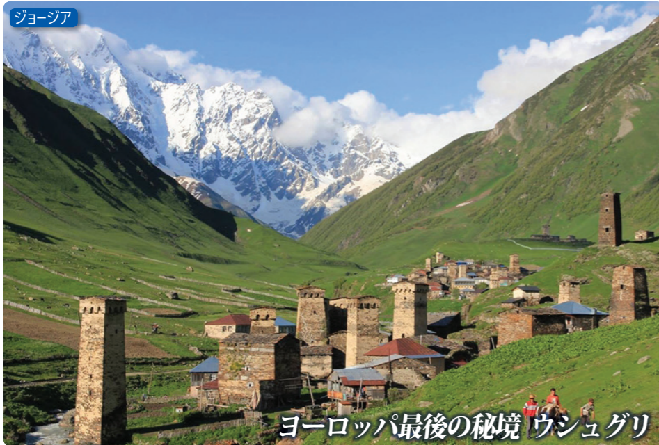
ヨーロッパ最後の秘境 ウシュグリ