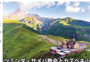
ツミンダ・サメバ教会とカズベキ山

ジョージア軍用道路を、十字架峠を越え、カズベキへ。山裾には緑の牧草地が広がり、雪を抱くコーカサスの山並みが美しい絶景ルートが続きます。当ツアーではカズベキに宿泊し、絶景のツミンダ・サメバ教会を訪れたり、ホテルからのんびりとカズベキ山の雄姿をご覧いただいたりと、山岳風景をお楽しみいただけます。