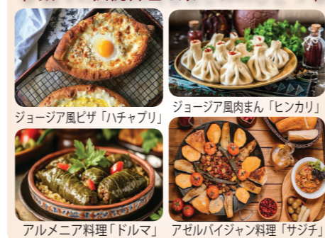
ジョージア風ピザ「ハチャプリ」