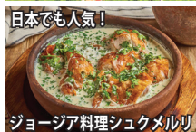
日本で人気! ジョージア料理シュクメルリ