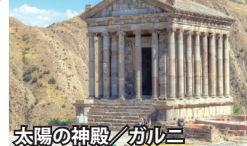
太陽の神殿/ガルニ

アララト山とホルヴィラップ修道院 世界で最初にキリスト教を国教とした国。イスラムの国に囲まれているが故、独自の文化を守り続けてきました。トルコとの国境付近からはノアの箱舟伝説で知られるアララト山の美しい姿が望めます。