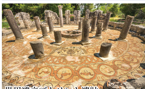
世界遺産ブトrint遺跡 アルバニア南部、ギリシアとの国境近くに築かれた古代ギリシアの港湾植民都市。イオニア様式の神殿や要塞、円形劇場、公衆浴場、さらに初期キリスト教の遺構などが残されています。

バルカン半島の南西に位置するコソボ、北マケドニア、アルバニア。正教文化とオスマントルコの足跡が入り混じり、まさに文明の十字路です。アドリア海の美しい海岸線、保存状態の良いローマ遺跡、紺碧の水を深く湛える世界遺産の湖、貴重な Fresco 画を見ることが出来る修道院群、また一歩郊外に出るとヨーロッパ最後の原風景とも呼べる素朴な風景が広がっているのです。知る人ぞ知るアルバニアの絶景地・神秘の泉"ブルーアイ"にもご案内します。