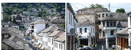
世界遺産ジロカストラ 15世紀からのオスマン帝国の時代、トルコとヨーロッパを結ぶ交易地として栄え、多くの邸宅が造られました。その街造りは独特で、道は石畳が敷き詰められ、家の壁も屋根もすべて石造り。当時の街並みは今でも美しく保存され、「石の街」と呼ばれます。