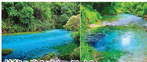
神秘の泉"ブルーアイ" 青く輝く、まるで瞳のように丸みを帯びた泉"ブルーアイ"。周辺の地層が石灰岩質のため、それが自然の濾過装置となり、透明な水を生み出しているのです。絶え間無く溢れ出る水は青い絵の具を落としたかのように美しいグラデーションを描く"青の絶景"です。