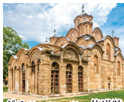
グラツァニツァ修道院 コソボのセルビア人地区にある修道院。壁天井柱を埋め尽くす Fresco 画は圧巻。世界遺産「コソボの中世建造物群」のひとつ。

※教会、修道院などは、急遽入場出来ない場合もございます。予め、お含みおき下さい。 ※成田空港発となる場合もございます。成田発となった場合、空港使用料・保安サービス料は、3,160円となります。 ※第6日目、ブルーアイは泉の状況、またはその他の理由で閉鎖となる場合もございます。予め、お含みおき下さい。 ※ヘラクリア遺跡とストビ遺跡のモザイク画は、保護の為に砂が被せられてご覧いただくことが出来ない場合もございます。