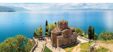
世界遺産オフリド湖 スラブ世界におけるキリスト教文化の中心として栄え、多くの教会や修道院が湖畔に建てられました。その文化的・歴史的景観と自然環境が、ユネスコの世界複合遺産に登録されています。

イヤホンガイド・サービスを使用します。 昼食時、夕食時にドリンク・ウォーターをサービスします。