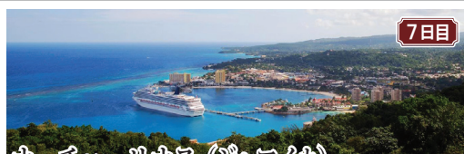
オーチョ・リオス(ジャマイカ) 煌めく太陽と美しいビーチ、緑豊かな自然など南国情緒あふれるビーチリゾート。