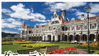
ダニーデン スコットランド移民によって築かれた町。フランダース・ルネッサンス様式の駅舎は歴史的建造物に指定されています。