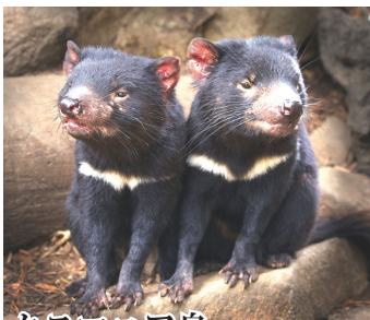
タスマニア島 ボノロング野生動物公園ではタスマニアデビルなどの固有種を見ることが出来ます。(オプションツアーにて)

※各寄港地におけるオプション・ツアーの内容や料金は変更になる場合がございます。予めお含みおき下さい。 ※テンダーボートを利用しての上陸になる場合もございます。 ※オーストラリア入国の際、ETA「電子渡航許可」(登録料実費20AUD)の事前申請が必要となります。現在、旅行会社での代行取得ができないため、お客様ご自身での手続きが必要となります。詳しくは、裏面の案内をご覧ください。