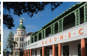
ネイピア アールデコ様式の建物が軒を連ね、開放的な雰囲気が漂う明るい港町。