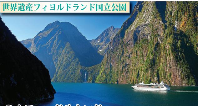
ミルフォードサウンド 氷河によって削られた断崖絶壁の山々と碧く輝く水面が織り成す絶景をお楽しみ下さい。クルーズ船に乗れば、切り立つ岸壁を流れる幾筋の滝や、蒼鬱と茂った多雨林などを至近距離から見る事が出来るのです。