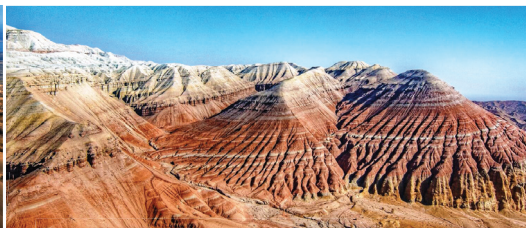
アルティン・エメル国立公園

高さ120m、長さ3kmにも及ぶ大砂丘。風で砂が飛ばされ崩れる時に低い音を出すことからシンギング・デューン(歌う砂丘)と呼ばれます。