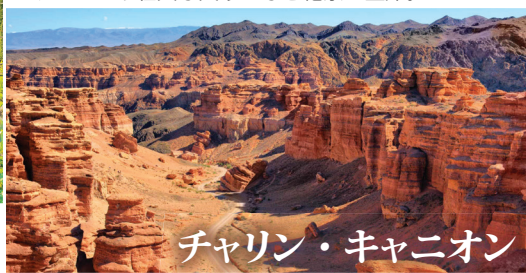
チャリン・キャニオン

カザフスタン随一の絶景スポット。かつて大地震で土砂崩れにより峡谷が塞がれてここに自然のダムが出来ました。やがて水位が上がってここに生えていたトウヒの木が水没して出来上がった不思議な景観です。