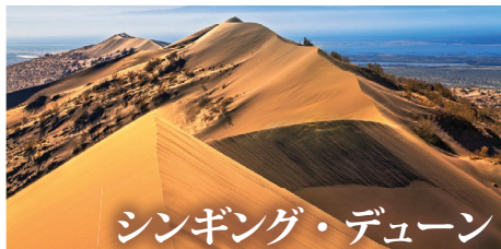
シンギング・デューン

※5～7日目は、民家風のゲストハウスの宿泊になり、設備は簡易なものになります。5日目サティのゲストハウスでは、共同トイレ・シャワーになる場合もございます。予め、お含み下さい。 ※道路事情により、小型車に分乗しての移動となる場合もございます。 ※天候により、ウォーキングなど観光内容が変更になる場合もございます。