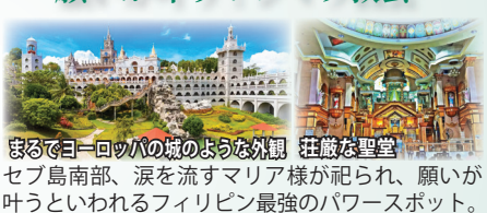
まるでヨーロッパの城のような外観 荘厳な聖堂 セブ島南部、涙を流すマリア様が祀られ、願いが叶うと言われるフィリピン最強のパワースポット。