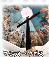
マゼラン・クロス