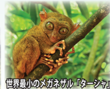
世界最小のメガネザル「ターシャ」

世界最小と言われるメガネザル「ターシャ」は、体長約10センチで、丸々とした大きな目が特徴。絶滅危惧種のため、保護センターなどで観ることが出来ます。