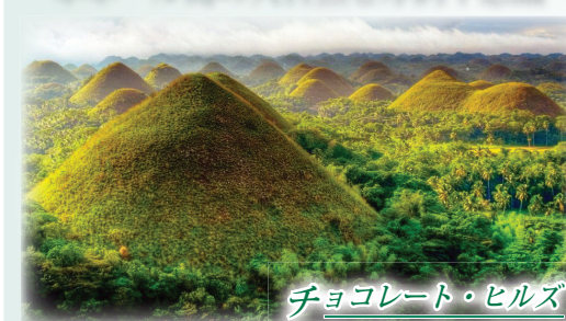
高さ30~40mの円錐型の小山が、周囲一帯に延々と連なっていて、その数は約1,200個。未だにその形成過程は謎の摩訶不思議な光景をご覧ください。