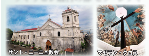
サント・ニーニョ教会