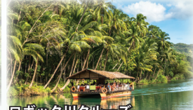
ロボック川クルーズ

世界最小と言われるメガネザル「ターシャ」は、体長約10センチで、丸々とした大きな目が特徴。絶滅危惧種のため、保護センターなどで観ることが出来ます。