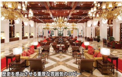
歴史を感じさせる重厚な雰囲気のロビー

1912年創業の老舗「ザ・マニラ・ホテル」に2連泊。フィリピン初の5つ星ホテルで、アジアを代表するクラシックホテルです。マッカーサー将軍、ビートルズ、チャールズ皇太子、ヘミングウェイ、マーロン・ブランドなどの著名人の他、各国元首や芸術家などが好んで宿泊したことで有名。白壁と緑の屋根が美しいスペイン風の建築で、豪華なロビーも特徴。伝統と格式が息づく雰囲気ながら、設備は近代的で快適に滞在いただけます。