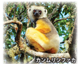
カンムリシファカ