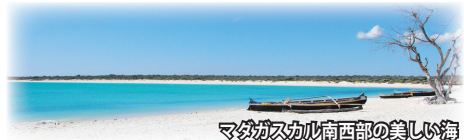
マダガスカル南西部の美しい海

◇ムロンダヴァに加え、アンドンピリーやアンダヴァドアカに群生する巨大バオバブ、樽型バオバブもご覧いただけます。