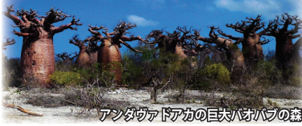
アンダヴァドアカの巨大バオバブの森

※第7、8日目のホテルは、国際水準に及ばない小規模な簡易宿泊施設となります。予めお含みおき下さい。 ※宿泊施設は、基本的にシャワーのみとなり、お湯の出など十分でない場合もございます。 ※全般的にロッジなどの宿泊施設の部屋数に限りがあるため、お一人部屋をご利用いただけない場合がございます。または、いくつかのロッジに泊泊となる場合もございます。 ※11日目、ワオキツネザルはレミュール・アイランドの奥地ではなく、別の場所で探検する場合もございます。 ※スムーズに日程を進めるため、朝食や昼食をお弁当とさせていただきます。移動は、中型車または小型車に分乗となります。 ※マダガスカル国内線スケジュールは流動的なため、日程・観光内容の変更を余儀なくされる場合もございます。