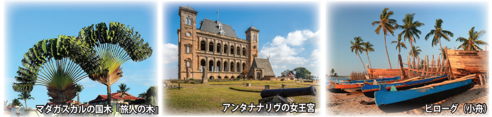
マダガスカルの木「旅次の木」