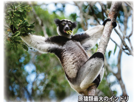
原猿類最大のインドリ