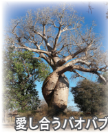
愛し合うバオバブ

西海岸のムロンダヴァから15km。そこには世界でも類を見ない不思議な光景が広がっています。小型バスを利用し、様々な種類のバオバブをご覧いただいた後、ゆったりと徒歩で散策していただく時間も設けています。まさに童話「星の王子様」の世界そのもの。