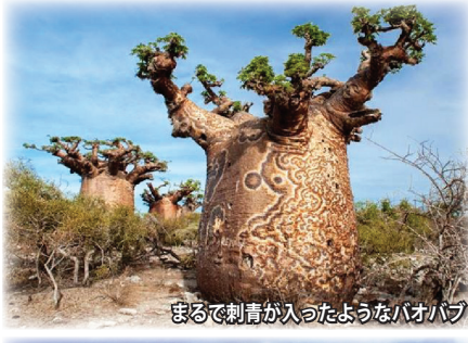
まるで刺青が入ったようなバオバブ