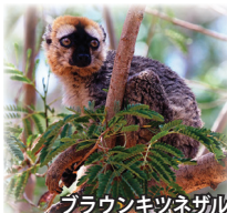
ブラウンキツネザル

世界最大の原猿類であるインドリが生息することで有名。家族単位で群れを作り、縄張りの内で生活をします。朝、歌うように鳴く鳴き声がとても印象的。