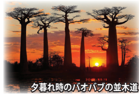
夕暮れ時のバオバブの並木道