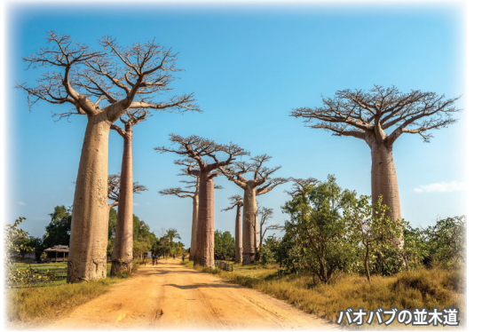
バオバブの並木道