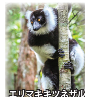
エリマキキツネザル