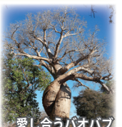
愛し合うバオバブ

西海岸のムルンダヴァから15キロ。そこには世界でも類を見ない不思議な光景が広がっています。「愛し合うバオバブ」「双子のバオバブ」など様々なバオバブをご覧いただく他、バオバブの並木道では、幻想的な夕暮れの模様も堪能します。