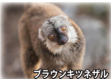
ブラウンキツネザル