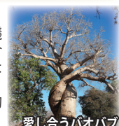
愛し合うバオバブ

西海岸のムルンダヴァから15キロ。そこには世界でも類を見ない不思議な光景が広がっています。「愛し合うバオバブ」「双子のバオバブ」など様々なバオバブをご覧いただく他、バオバブの並木道では、幻想的な夕暮れの模様も堪能します。