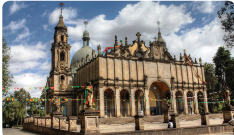
三位一体教会 国内最大の教会。エチオピアが第二次世界大戦時に史上初めて一時的に他国(イタリア)に占領されたものの、再び独立を獲得した事を記念して建設された教会。エチオピアでは最も崇拜されている教会の一つです。