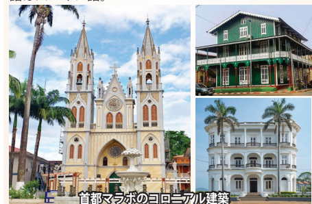
首都マラボのコロニアル建築

アフリカ大陸にあるムビニ地域と首都マラボのあるピオコ島を含む5つの火山島から成る国。首都はピオコ島ですが、面積の90%は大陸のムビニ地区で、人口の大半が居住しています。1968年にスペインから独立。ブラック・アフリカで唯一の旧スペイン領。近年の石油開発により経済成長は見られるものの、国民は相変わらず貧困に苦しんでいます。公用語はスペイン語。