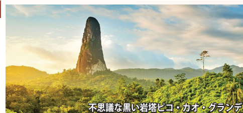
不思議な黒い岩塔ピコ・カオ・グランデ

ギニア湾に浮かぶサントメ島、プリンシペ島と小さな島々から成る共和国。無人島でしたが、1470年にポルトガル人が上陸、流刑地として使われる一方、奴隷貿易の中継基地となりました。1975年にポルトガルより独立。サントメ島に人口の90%が居住。カカオのプランテーションが主要産業。近年、沖合に新しく油田が発見され、近い将来石油の産出が見込まれています。公用語はポルトガル語。