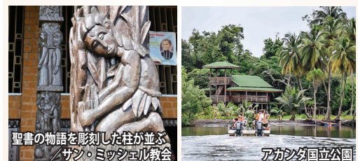
聖書の物語を彫刻した柱が並ぶサン・ミッシェル教会

先住民としてバントゥー語系の人々が暮らしていましたが、15世紀末にポルトガル人が渡来し、奴隷貿易を行いました。1839年からフランスの植民地に。首都はフランス語で「自由の町」を意味する「リーブルビル」。解放奴隷たちの自由への願いをこめ、1960年にフランスから独立。小国ではありませんが、石油、マンガン、鉄などの鉱物資源に恵まれ、1人当たりの所得がアフリカで最も高い国の一つ。国土の8割を森林地帯が占めることから、「地球の肺」とも呼ばれています。2002年、森林と野生動物を保護するため、13の国立公園を設定。その総面積は実に国土の約11%を占める自然大国です。公用語はフランス語。