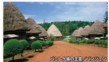
バミレケ族の王宮/バンジュン