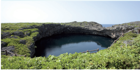
下地島「通り池」

2次離島の多良間島からチャーター船でしか訪れることの出来ない離島マニア憧れの島、3次離島の水納島も訪問いたします。