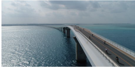
伊良部大橋