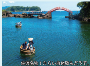
佐渡名物！たらい舟体験もどうぞ。