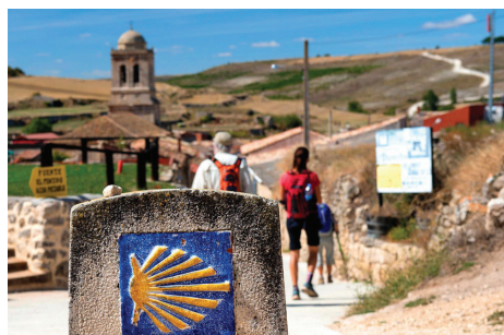
聖地サンティアゴ目指し、巡礼路ラスト100kmをゆったりと歩く