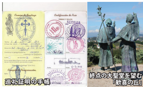
巡礼証明の手帳 終点の大聖堂を望む「歓喜の丘」