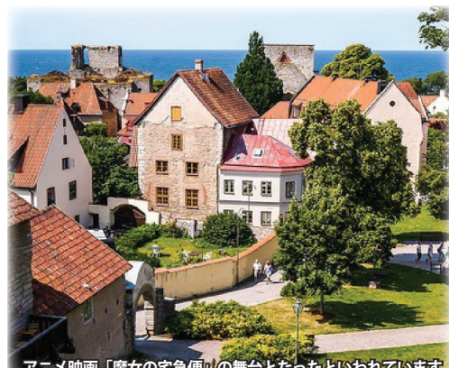
アニメ映画「魔女の宅急便」の舞台となったといわれています

バルト海に浮かぶスウェーデン最大の島・ゴットランド島。島最大の町ヴィスビーは、12～15世紀にハンザ都市として栄えました。島内各地には古い教会や遺跡・廃墟が残り、往時の繁栄を偲ばせます。町の周囲には約3キロに及ぶ城壁が残り、中世ハンザ都市の典型的な町として世界遺産に指定されています。赤茶色の屋根の家々、石畳の小道など中世が残る旧市街の散策をのんびりとお楽しみ下さい。