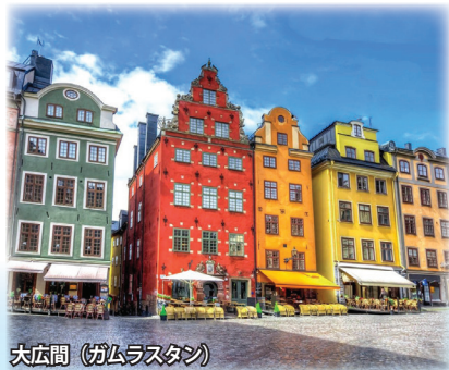
大店間(ガムラストン)

スウェーデンの首都ストックホルムは、バルト海とメーラレン湖に囲まれた大小14余りの島々から成るため、「水の都」、「北欧のベニス」と呼ばれます。北欧最大の都市ではありませんが、面積は東京23区より小さくコンパクトにまとまっていて、中世が残る旧市街や豊かな自然が残る島など、1つの都市とは思えないほどエリアによって雰囲気が異なり訪れる者を飽きさせません。どこを切り取っても絵になるため“世界一美しい首都”と呼ばれています。今回、メトロ駅近くのホテルにゆったり6連泊滞在。旧市街ガムラストンなどの街歩きや世界遺産ドロットニングホルム宮殿の見学だけでなく、バルト海に浮かぶ世界遺産ゴットランド島への終日観光や近郊の国内最古の趣ある町シグトゥーナ訪問などにご案内します。