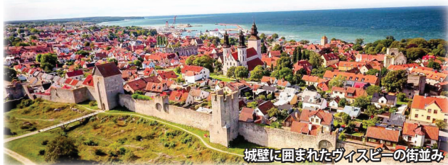
城壁に囲まれたヴィスビーの街並み