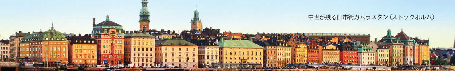
中世が残る旧市街ガムラストン(ストックホルム)