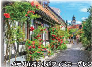
バラの花咲く小道フィスカーグレン