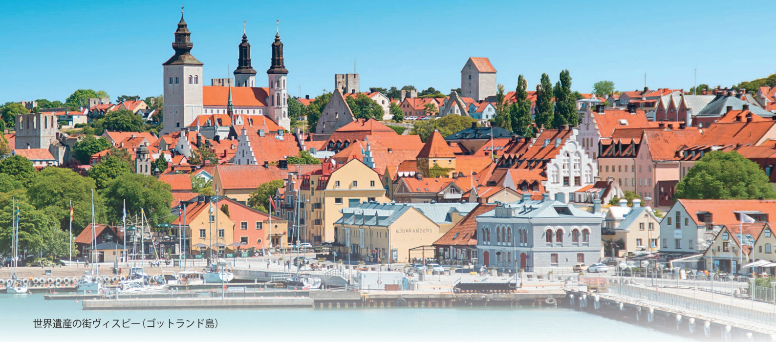
世界遺産の街ヴィスビー(ゴットランド島)