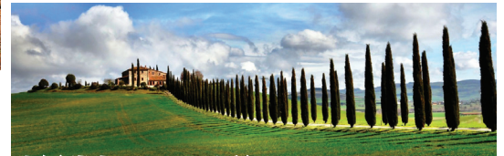
世界遺産オルチャ渓谷 なだからに連なる丘、立ち並ぶ糸杉、パッチワークのようなオリーブ畑やブドウ畑...まさに絵画のような美しさです。