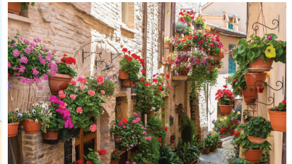
スペッロ 今も昔ながらの石造りの家が並ぶ美しい町。小道の軒先には可愛らしい花や植木が並び、古き良きイタリアの町を彷彿させます。