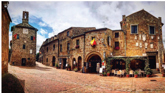
ソヴァーナ トスカーナ南部マレンマ地方、山の谷間に付むその町は中世から時が止まったかのよう。町全体が凝灰岩の黄土色をしていて、他とは異なる独特の雰囲気です。その美しさは、イタリア人でさえも「宝石のよう」と讃える町なのです。