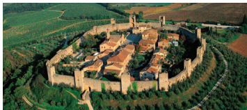
モンテリッジオーニ ほぼ中世が完全に残る王冠のような城塞都市。