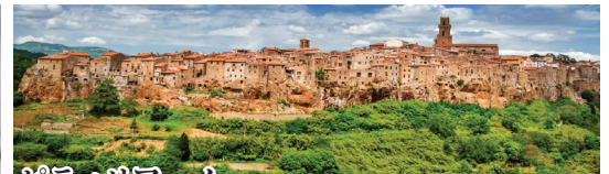
ピティリアーノ トスカーナ南部マレンマ地方、森の中に突如現れる凝灰岩の絶壁にそそり立つ村がピティリアーノ。エトルリア時代からの歴史をもち、町の中にはメディチ家の命によって造られたアーチの美しい水道橋が残る。