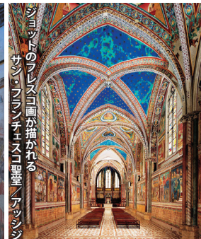
ジョットのフレスコ画が描かれるサン・フランチェスコ回廊(アッシジ)