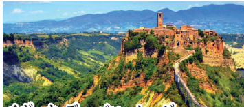
チヴィタ・ディ・バニョレージョ 切り立った崖の上に浮かぶ唯一無二の景観の村。