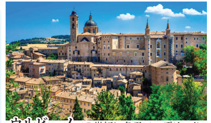
ウルビーノ 15世紀に名君フェデリコ公がイタリアやヨーロッパ各地から芸術家を招いて築いた「理想都市」。今もルネッサンスの香り溢れる美しい面影を残しています。