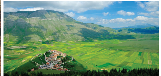
ピアーノ・グランデ大平原 マルケ州・海拔1275mの高台にある「天空の高原」。雄大な草原と丘の上の小村カステルッチョは、まさに絵になる光景です。