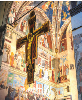
サン・フランチェスコ教会のアレツツォ