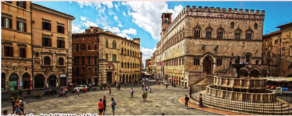
ペルージャ旧市街周辺4連泊 古代エトルリア時代からの歴史をもつペルージャ。街の城壁や城門にエトルリア時代の見事な建築を見ることが出来ます。街の中心・11月4日広場には、繊細な彫刻が施された大噴水などが残り、歩いているだけでも多くの芸術作品に出会えます。立地の良いホテルなので中世の街並みをのんびり散策下さい。