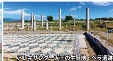
アレキサンダー大王の生誕地・ペラ遺跡

*** ペロポネソス半島も周遊し、古代ギリシャとビザンチンの世界を巡ります ***