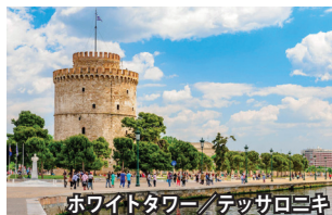
ホワイトタワー / テッサロニキ

遙かインダスまでの大帝國を築き、東西の文明を交流させるきっかけともなったアレキサンダー大王の故郷であるマケドニア地方。生誕地ペラや王国最初の都ヴェルギナを訪問。また、ギリシャ第二の都市テッサロニキでは、見事なモザイク画で知られるビザンチン様式のアギオス・ディミトリオス教会（世界遺産）を訪れます。