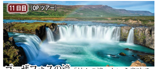
11日目(OPツアー) ゴーザフォスの滝「神々の滝」という意味で、アイスランドの滝で最も美しいと言われています。