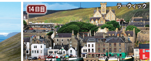
14日目 シェトランド諸島 英国領土最北端の島々。15世紀まではノルウェー領であったためスカンジナビア文化が残る英国の異郷。