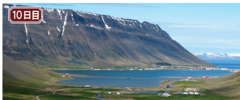
10日目 イーサフィヨルズル アイスランド語で「氷のフィヨルド」を意味し、周囲を岩肌の美しいフィヨルドに囲まれていた町です。