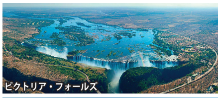
ビクトリア・フォールズ