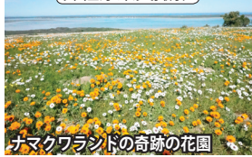
ナマクワランドの奇跡の花園

イヤホンガイド・サービスを使用します。 昼食時、夕食時にドリンク・ウォーターをサービスします。