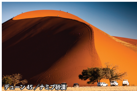
デューン45/ナミブ砂漠

ナマクワランドのワイルドフラワーの時期に南部アフリカ5カ国(ナミビア、南アフリカ、ジンバブエ、ザンビア、ボツワナ)の見所をたっぷりと巡ります。 ◇南アフリカ共和国北西部に広がるナマクワランド。年間降水量300mmほどの荒涼とした大地に、8月中旬から9月上旬の1年でたった数週間だけ、一面の花の絨毯で彩られます。当ツアーでは野生の花々の鑑賞に3日間に渡り、ご案内します。その時の開花状況に応じて、臨機応変に最良の自生区を訪れます。 ◇ナミブ砂漠では、圧倒の赤い砂丘、最深部のソッサスプレイまでじっくりと観光します。 ◇ケープタウンでは、テーブル・マウンテン、アフリカ大陸の果て・喜望峰、ペンギンたちとの出会いなど見所を巡ります。 ◇世界三大瀑布の一つ「ビクトリアの滝」ではジンバブエ側とザンビア側の両方から滝を観光します。また、隣国ボツワナのチョベ国立公園も訪れ、サファリ・ドライブもお楽しみいただけます。